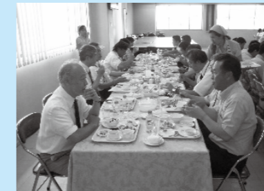
ローチェロボテック株式会社にて会食