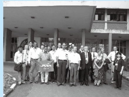
インド真空協会(IVS)訪問