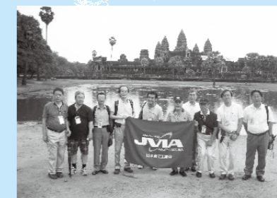
アンコールワット