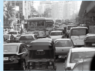
ムンバイの街並み