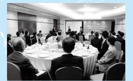
真空関連団体の調印式