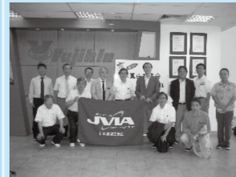
フジキンベトナムでの集合写真