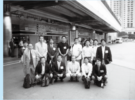
セミコン・ウエスト2008会場前