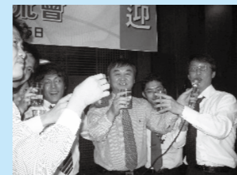
KOVRAとの懇親パーティー