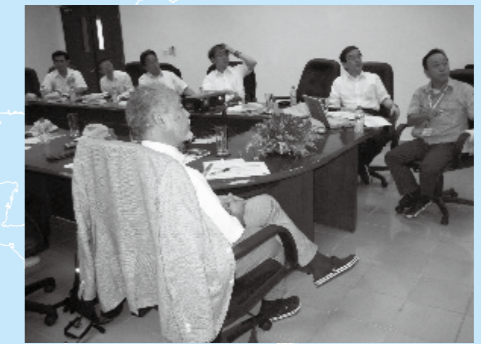
フジキンベトナム