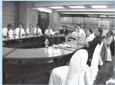
バンガロールHind High Vac