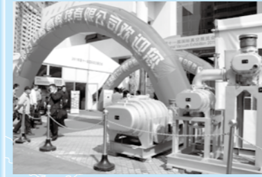
視察ツアー集合写真