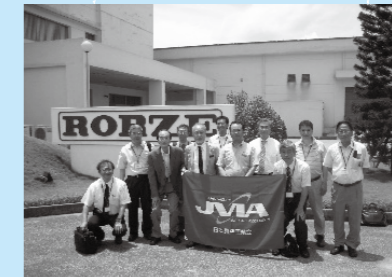
ローツェロボテック