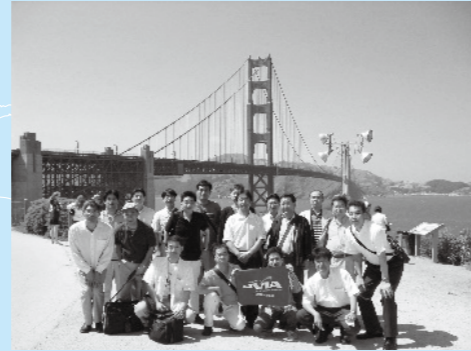
ゴールデンゲートブリッジにて