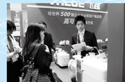
ブースにおける説明を受けているところ