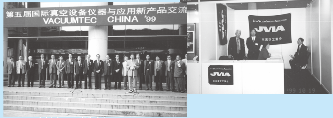
「VACUUMTEC CHINA '99」に参加して