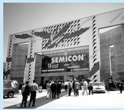
「セミコン・ウエスト2001」に参加して