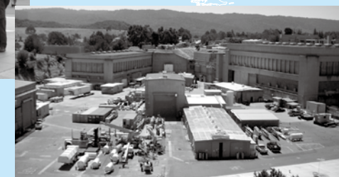
スタンフォード線形加速器センターの外観