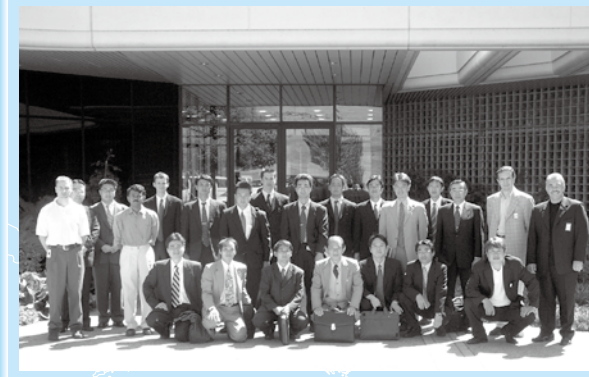
「セミコン・ウエスト2002」参加者一同