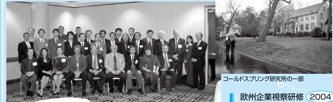
AVEMの皆さんと視察団員