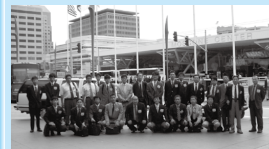
「セミコン・ウエスト2004」会場(コンベンションセンター)前にて