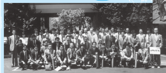
「セミコン・ウエスト'89」 会場前にて