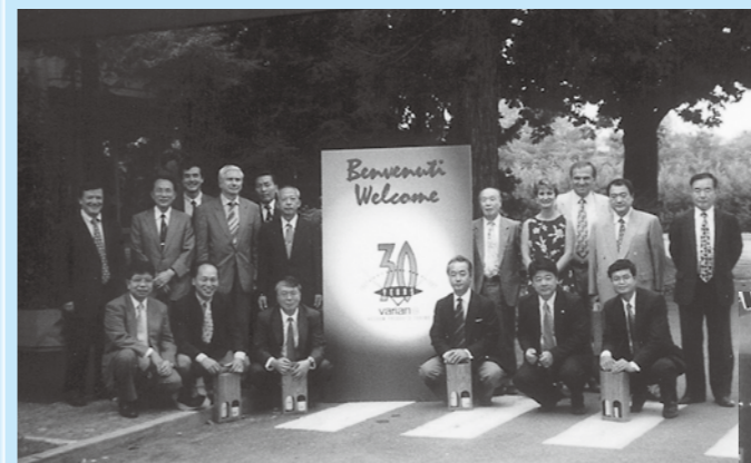
IVC14欧州企業視察に参加して