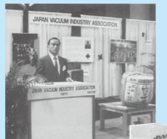
ひときわ目立つJVIAブース